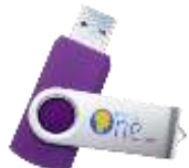
Monte Cristo 2