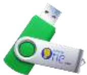
Monte Cristo 3