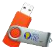
Arnica Montana 2