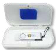
Le boîtier des clés USB

Les clés USB Bio Music One se branchent sur tout appareil moderne qui intègre une prise USB (ordinateur, tablette, téléphone mobile avec un adaptateur, chaîne hifi, TV, lecteur CD, véhicule, etc.)