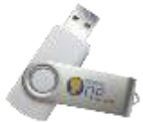
Les 6 albums