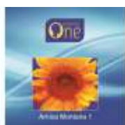
ARNICA MONTANA 1