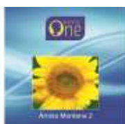
ARNICA MONTANA 2