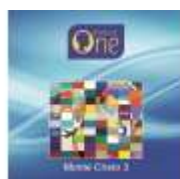
MONTE CRISTO 3