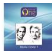
MONTE CRISTO 1

Tous les albums Bio Music One intègrent et diffusent les CUOS bénéfiques du procédé pour tous les êtres vivants : humains, animaux, plantes et minéraux.