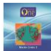
MONTE CRISTO 2